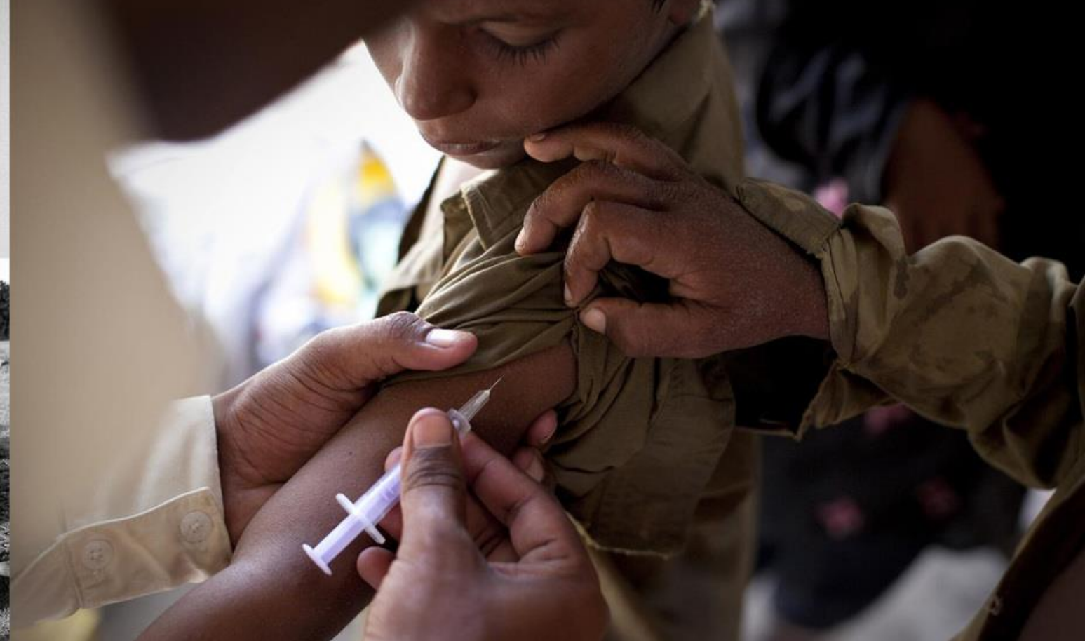
Pakistan , 2010 r. Pracownik medyczny szczepi chłopca przeciwko gruźlicy w tymczasowym obozie dla ofiar powodzi. Czynnikiem powodującym rozwój chorób są katastrofy naturalne, w tym właśnie powodzie, które zanieczyszczają źródła wody pitnej i zmuszają ludzi do przesiedleń.