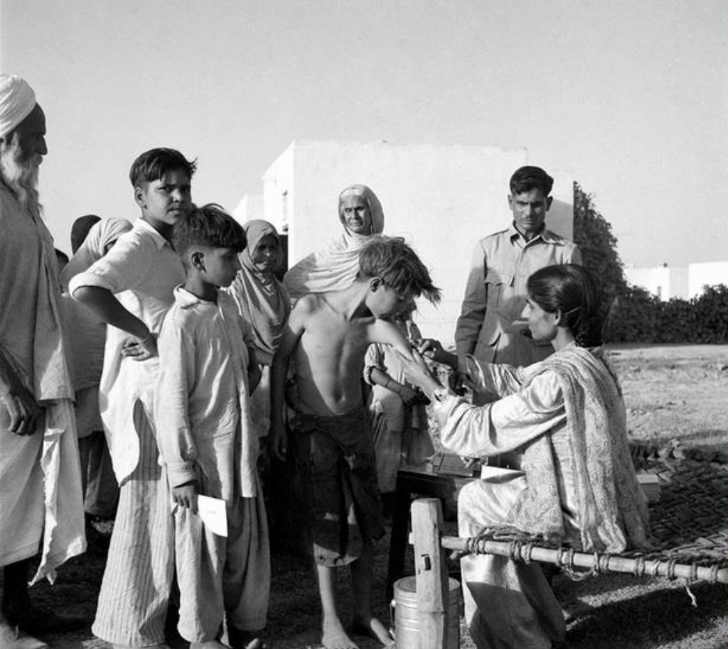
Indie , 1949 r. Pracownik medyczny szczepi chłopca przeciwko gruźlicy w Indiach niedaleko Deli.